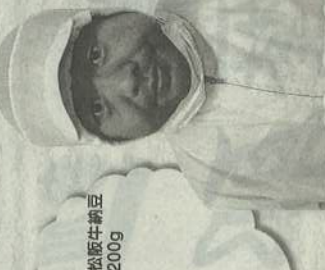
こんなのあるんだ!