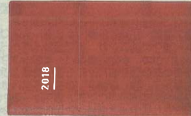
ココヨの「シアン手帳B」