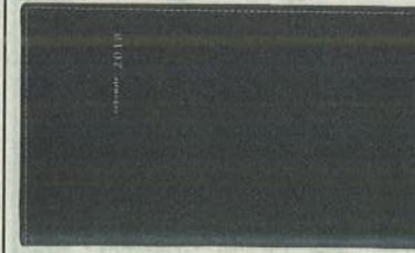
高橋書店の「アウアン」