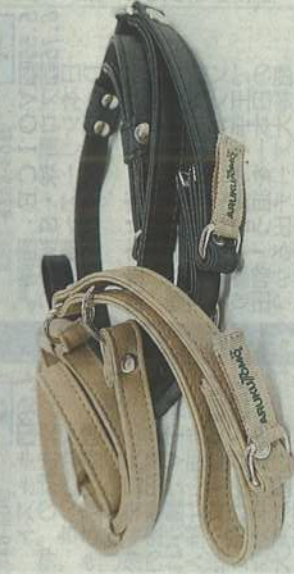
⑤シヨルターベルト「アルクト王」⑥車椅子に乗る女性が使いやすいバッグ

003年に初代の加湿器を発売したが「全く売れず、撤退もやむなしと言われるほどだった」と振り返る。顧客アンケートなどによって、静音性が不十分だったことが分かった。「寝室や個室で使うにはうるさいと感じられていた。モーターの取り付け方や送風経路を見直し、作動音を抑えた。就寝時に音が気になるとの指摘に対応、最小運転音の「おやすみ加湿モード」を搭載した。水を含んだフィルターに風を当てて蒸発させる気化式