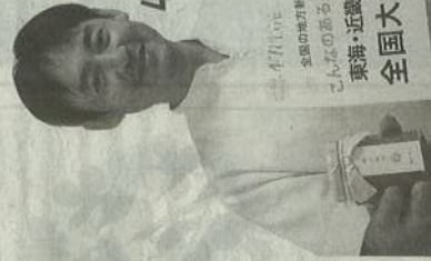
47クラブ 全国の地方産品を応援する。 こんなのあるんだ! 大賞2016 東海・近畿ブロック大会 全国大会 出場権

地方の価値ある逸品を集めた47クラブで2016年度「こんなのあるんだ大賞」で最優秀賞を受賞した商品です。柿のやさしい甘みとパターの香りが最高です。 柿150g