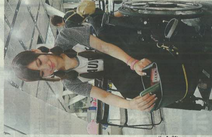
バッグを使うみゆうさん

繊維加工の「鈴木工業所」(浜松市)は今年8月、新ブランド「ADOM(アドム)」の第1号として、車椅子に乗る女性が使いやすいバッグ(送料込み1万4018円)を発売した。インターネットで購入できる。